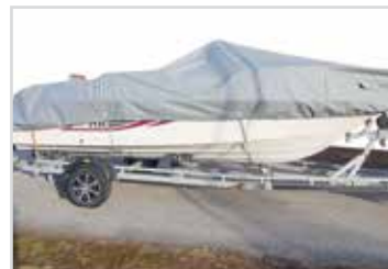
Transport/ förvaringskapell Rek pris 6 770 kr.