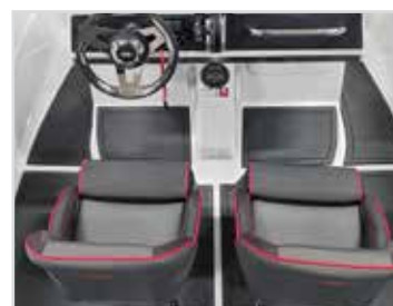
Softfloor Rek pris 13 000 kr.