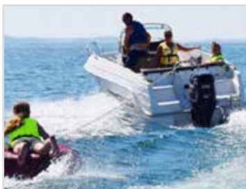
Vattenskiåkning En rejäl vattenskiåkning för vattensportsaktiviteter. Rostfri.