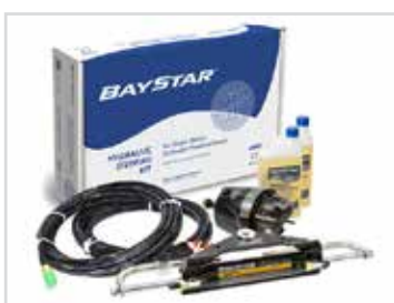
Hydraulstyrning från Baystar Plus.