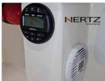
Stereo från Hertz Marine Bluetooth.