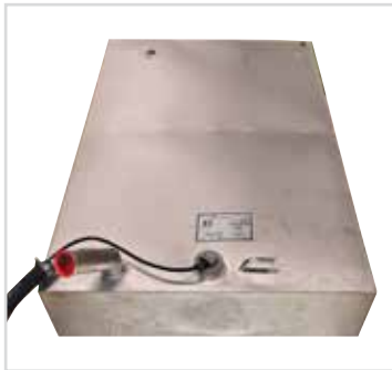
Fast tank på 170 liter.