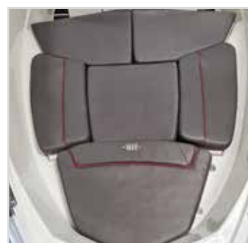
Solbädd lläggsskiva samt dyna. Rek pris 6 900 kr.