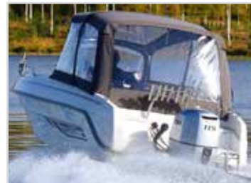
Akterkapell som går att använda helt eller delvis uppsatt. Rek pris 13 500 kr.