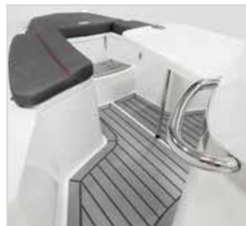
Laminatduk Rek pris 13 500 kr.