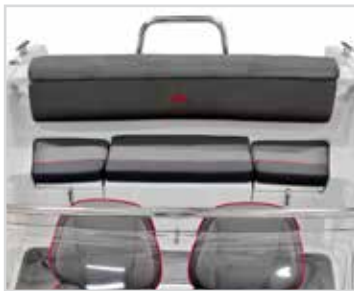
Komplett dynsats fram och bak.