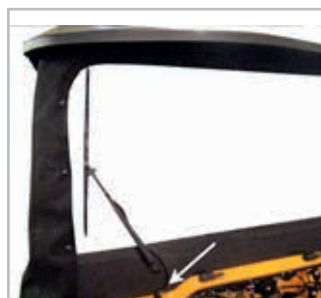
Windshield Viper Vnr 900-0105