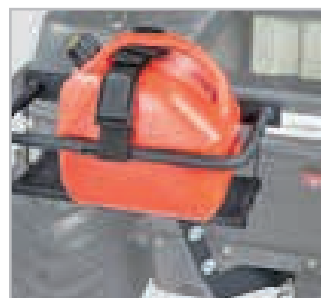
Bensinkanneholder Vnr 867-01