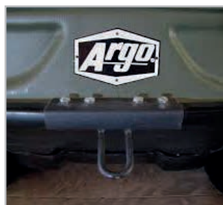
Tilhenger krok Vnr 642-00