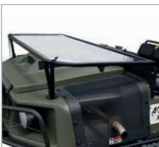
Folding Windshield Vnr 958-192