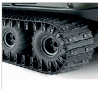
Tracks/Belter Vnr 825-50-1-NE