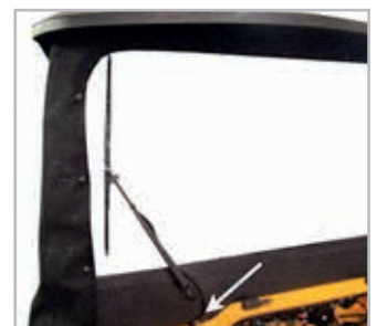
Windshield Viper Vnr 900-0105