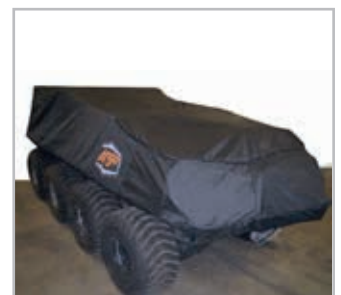
Cover 8x8 Vnr 900-0120