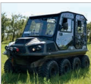
DFK Cabin Vnr 66S02U01-0