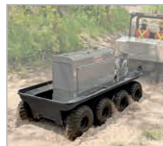
Tilhenger med 8 hjul Vnr Argo Trailer 8 Blk