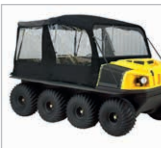
XTI Convertible Top Vnr 958-171