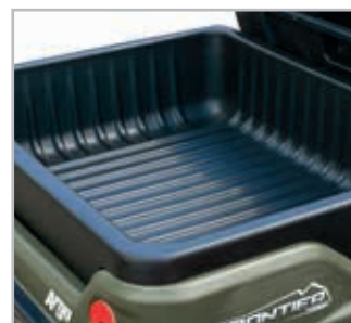
Cargo Liner Accessory Vnr 900-0075