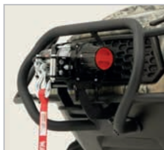
Brushguard Vnr 900-0036