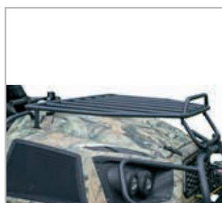
Hood Rack Vnr 900-0073