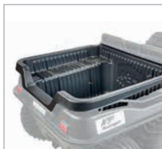
Bedliner Vnr 866-01