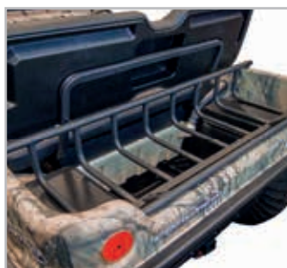
Rear Rack Accessory Vnr 900-0074