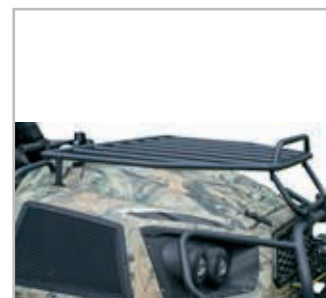
Hood Rack Vnr 900-0073