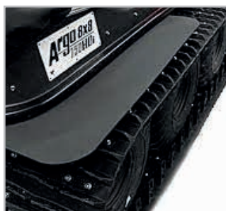
Mud Flap assembly Vnr 625-10