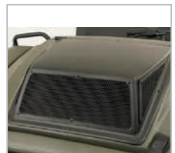
Hood Fan Conquest Vnr 900-0194