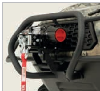
Brushguard Vnr 900-0036