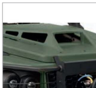
Hood Fan Conquest Vnr 900-0104