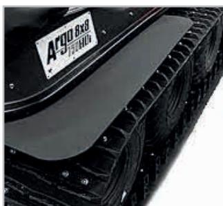
Mudflaps Vnr 625-10