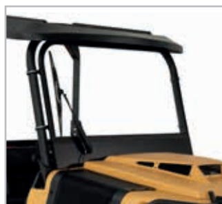
Windshield XTI Vnr 958-90