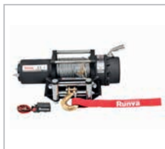
Vinsj 5500 Vnr EWX5500A-12SR