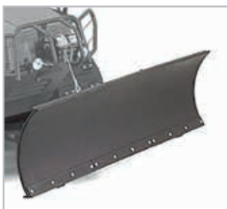
Snø plog Vnr 657-21