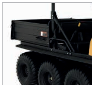
Dumpbox Conquest Vnr 900-0197