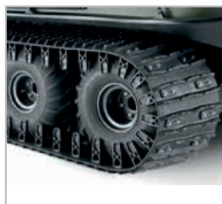
Tracks/Beltes Vnr 825-50-1-NE