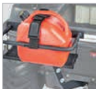
Bensinkanneholder Vnr 867-01