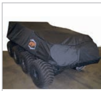
Cover 8x8 Vnr 900-0120